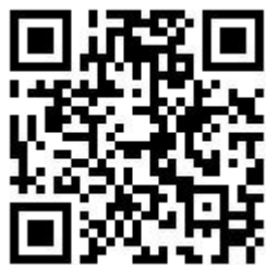
課指組 F B